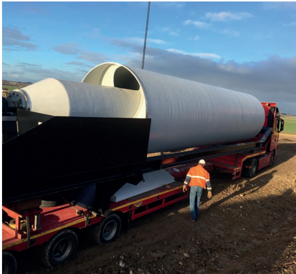
Buisvijzel met een diameter van 2,5 meter. De Delta21-buisvijzels worden vier maal zo groot.