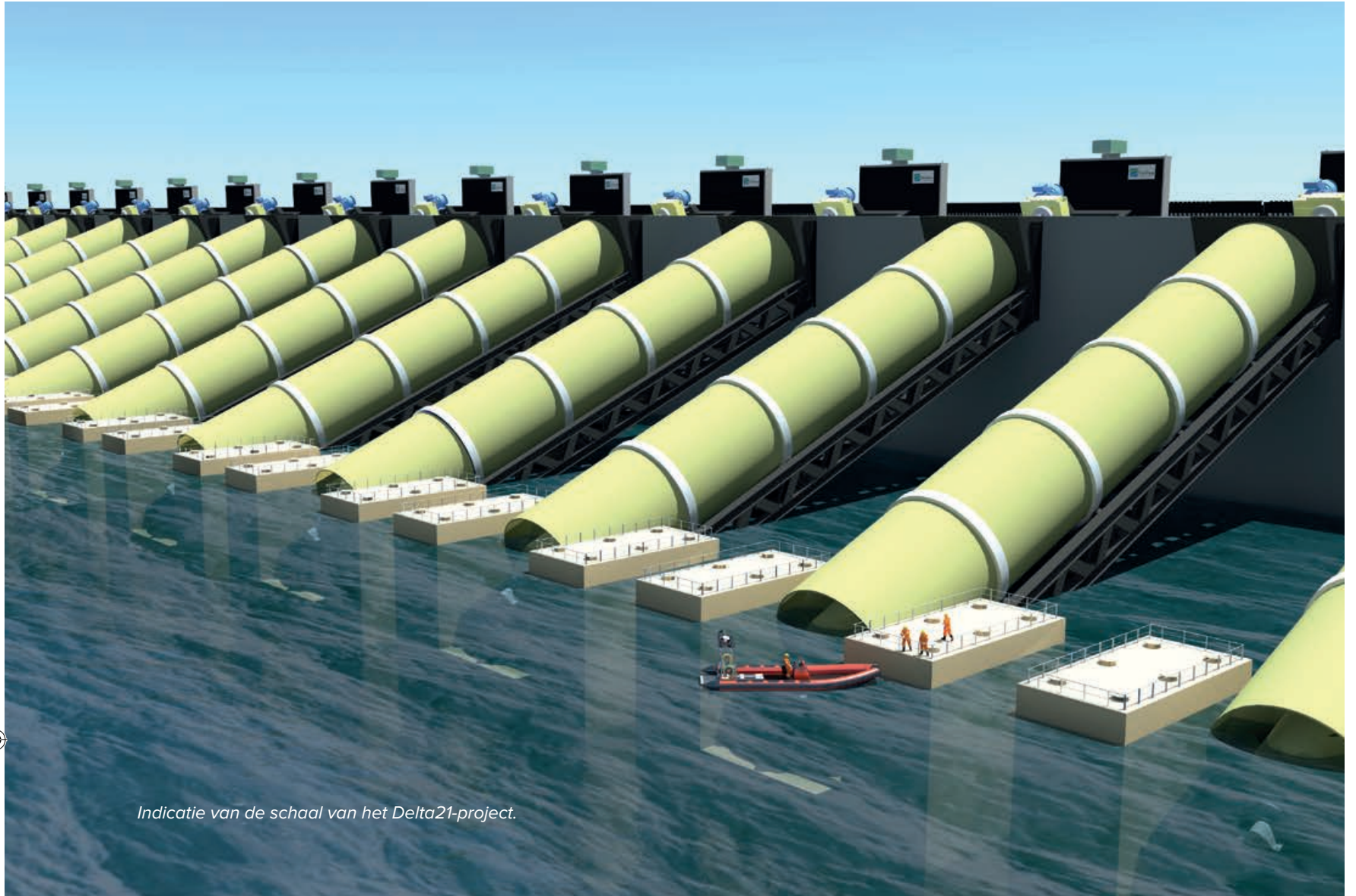
Indicatie van de schaal van het Delta21-project.