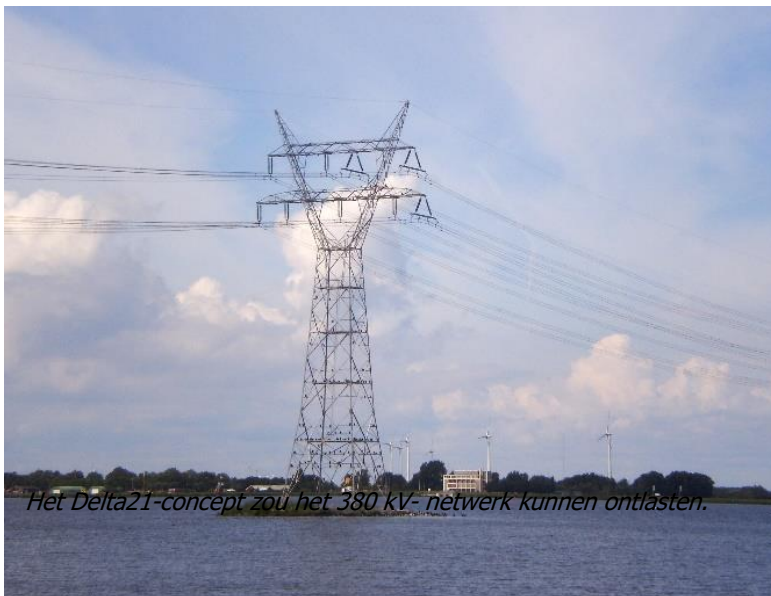
Het Delta21-concept zou het 380 kV-netwerk kunnen ontlasten.

Het ministerie van Economische Zaken en Klimaat vindt de integratie van zonne- en windparken binnen het concept veelbelovend. Zij pleit ervoor het energieopslagmeer aan te laten sluiten op de nieuwe kerncentrales die mogelijk in Borssele verrijzen en tevens op de waterstoffabrieken die op de Maasvlakte gebouwd gaan worden.