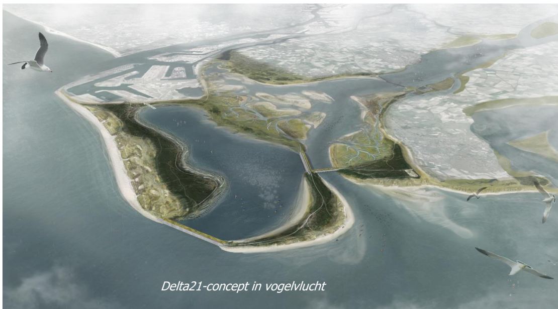
Delta21-concept in vogelvlucht

Nederland staat voor grote opgaven om het leven voor komende generaties leefbaar te houden. In allerlei overheids- en beleids-gremia wordt nagedacht over klimaatverandering, afstand nemen van fossiele brandstoffen, waterveiligheid en natuurherstel. Kenniscentra doen onderzoek op elk van deze thema's. Het Delta21-concept bundelt – als het integraal wordt uitgevoerd – oplossingen voor alle drie deze thema's: energie-zekerheid, waterveiligheid en natuurherstel. In dit haalbaarheidsonderzoek focussen we op de voordelen van grootschalige energieopslag in ons concept.