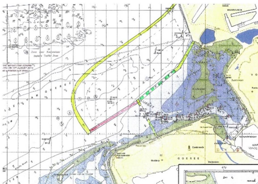
Het ontwerp zoals gemaakt door Esmée van Eeden.

De te maken investeringen in pumped storage hydro kan met diverse vormen van baten worden terugverdiend. Er is uitgegaan van een terugverdienperiode van 30 jaar, maar de levensduur van het bassin is, met uitzondering van de pompturbines, minstens 100 jaar. Vanwege de hoge voorinvesteringen weegt de hoogte van de rentelasten zwaar op de exploitatie. Waar we in de huidige situatie steeds meer overtollige energie weg moeten gooien bij een hoog aanbod en lage vraag, kun je in de nieuwe situatie die energie goed vermarkten. Die energie is groen en schoon en voorziet in een optimaler gebruik van andere energiebronnen. In de nieuwe situatie hoef je dus minder uit te geven om de CO 2 -uitstoot te verlagen naar netto 0.